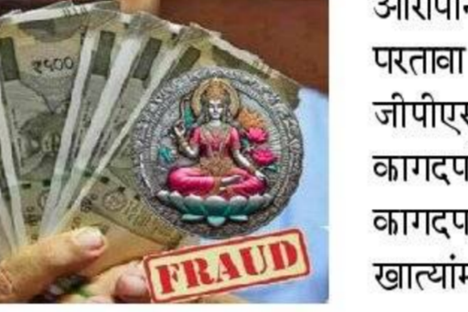
आणि छायाचित्र मागले. त्यानंतर त्यांना वस्तू व सेवा कर नोंदणी करण्यासाठी काही रक्कम पाठविण्यास सांगितले. ही प्रक्रिया तेवढ्यावरच थांबली नाही. आरोपीने त्यांना हस्तांतरित करार, विक्रीकर, परतवा दाखल, नोंदणीकरणाचे प्रमाणपत्र, जीपीएस, टीडीएस, विमा अशी विविध कागदपत्रे तक्रारदाराला पाठवली. त्या सर्व कागदपत्रांसाठी तक्रारदाराला विविध बँक खात्यांमध्ये रक्कम भरण्यास सांगितले.