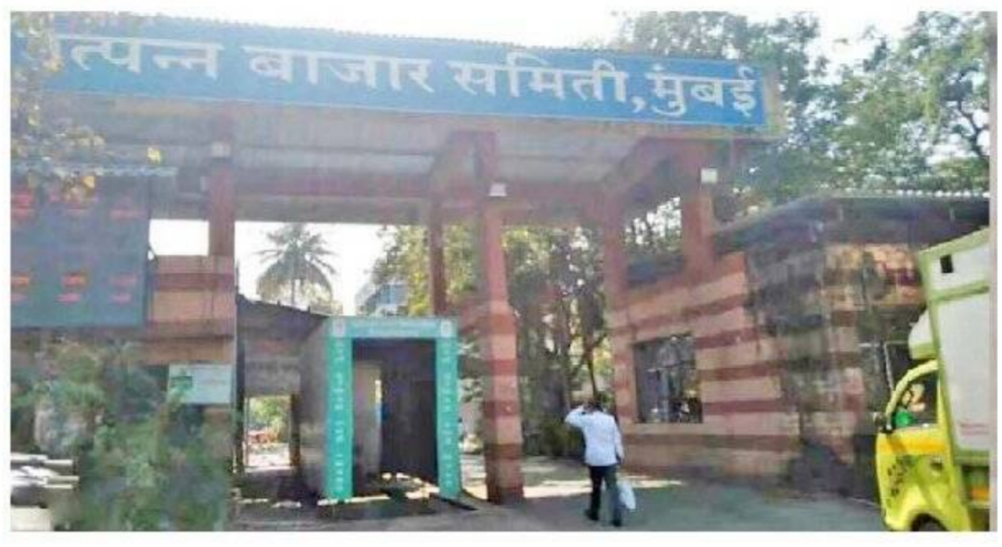
एपीएमसीकडून काही ठिकाणी सीसीटीव्ही बसविण्यात

दोन ते तीन वर्षापूर्वी खासदार निधीतून बाजारात सीसीटीव्ही बसविण्यात आले होते. मात्र काही चालू तर काही बंद तर काही ठिकाणी सीसीटीव्हीच नाहीत. अशी अवस्था आहे. फळ बाजारात चोरीच्या घटना घडतच असतात. तर काही वर्षापूर्वी फळ बाजारात बॅयटिक वादातून एका व्यक्तीने वाहन स्फोटक व ज्वलनशील पदार्थ ठेवून स्फोट घडवून आणला होता. मसाला बाजाराच्या आवाराबाहेर मोठ्या गटारात एक अज्ञात मृत इसमाचा सांगाडा निदर्शनास आला.