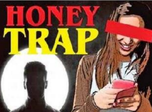
गुन्हा दाखल करण्यात आला होता, अशी माहिती पोलिसांनी दिली. या टोळीने अनेकांना मोहजालात अडकवून लुटल्याचा संशय आहे. त्यादृष्टीने तपास करण्यात येत आहे. कोथरुड भागातील एका ज्येष्ठाला मोहजालात अडकवून महिलेने एका हॉटेलमध्ये नेले. त्यानंतर पोलीस आणि महिला हक्क आयोगाचे सदस्य असल्याचे सांगून ज्येष्ठाला माहाराण करण्यात आली. बलात्काराचा खोटा गुन्हा दाखल करण्याची धमकी देऊन पाच लाख रुपयांची खंडणी मागितली. त्याच्याकडील २० हजारांची रोकड मोबाइल संच काढून घेण्यात आला. २९