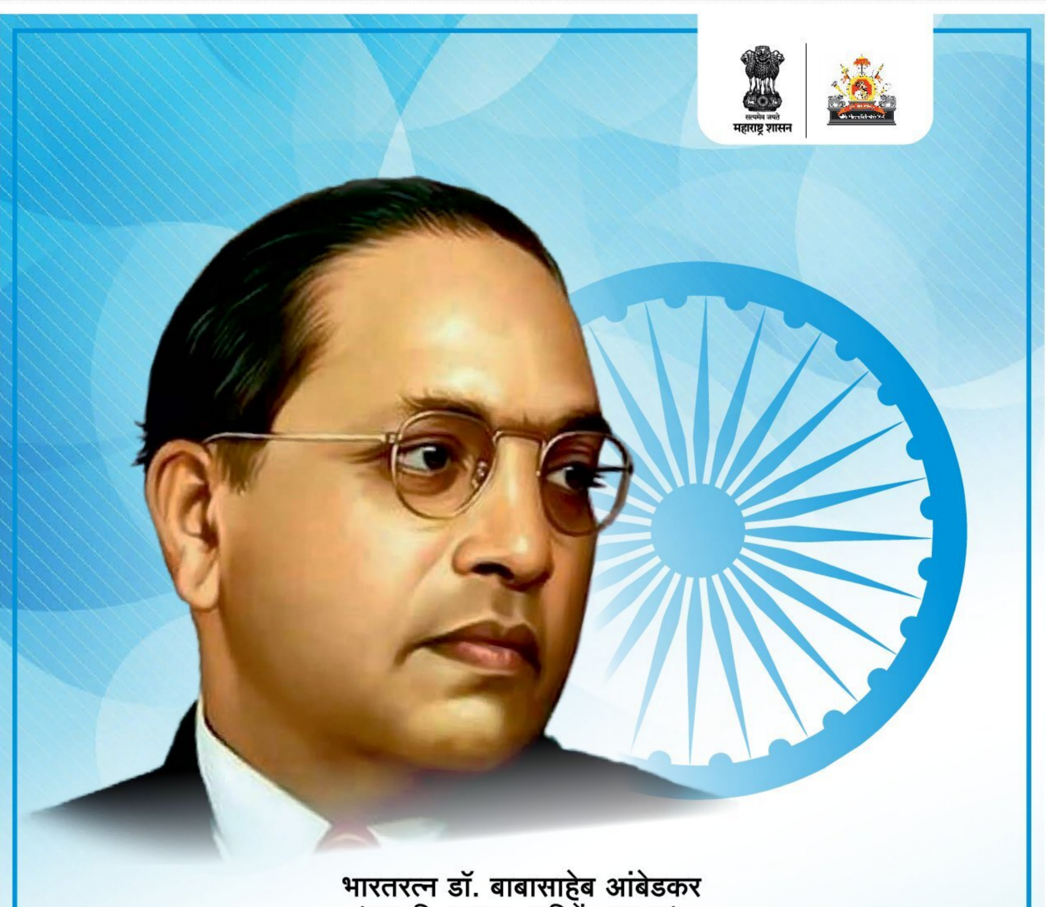
भारतरत्न डॉ. बाबासाहेब आंबेडकर (१४ एप्रिल १८९१-६ डिसेंबर १९५६)

प्रचाराच्या दरम्यान साड्या, मद्य, भेटवस्तू यांचं वाटप केल्यास कारवाई केली जाणार आहे. निवडणूक प्रचारदरम्यान अशा कुठल्याही व्यवहाराला थारा दिला जाणार नाही. ही माहिती राजीव कुमार यांनी दिली आहे. त्याचप्रमाणे खोटेबातयांमार्गीची सत्यताही आम्ही तपासणार आहोत. त्यासाठी वेबसाईट तयार केली जाईल असंही मुख्य निवडणूक आयुक्त राजीव कुमार यांनी म्हटलं आहे.